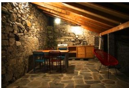
gedeckter Sitzplatz nachts