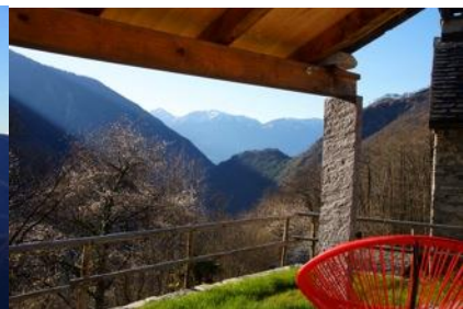
Terrasse Richtung Südost