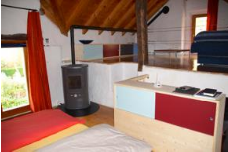
Schlafzimmer im Wohnhaus