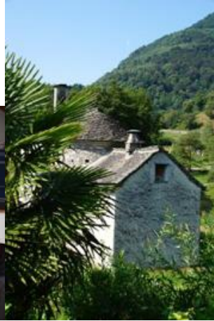
Blick nach Süden: Oratorio Madonna di Montenero