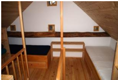
Schlafgalerie im Bewegungsraum